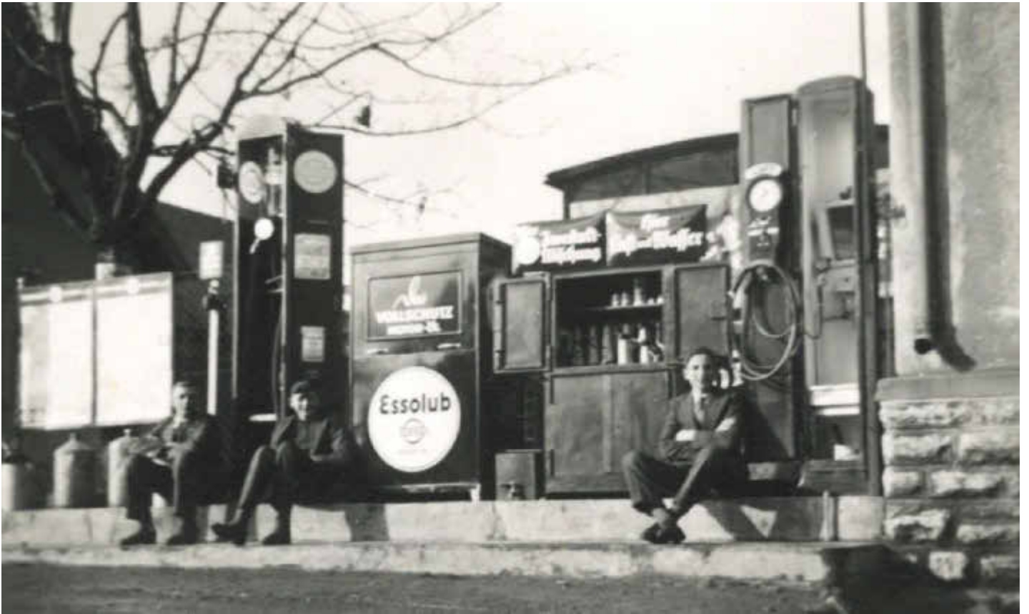
Tankstelle in der Würzburger Straße 50

Ein Foto ist ein Rückfahrticket zu einem Moment, der sonst weg wäre.