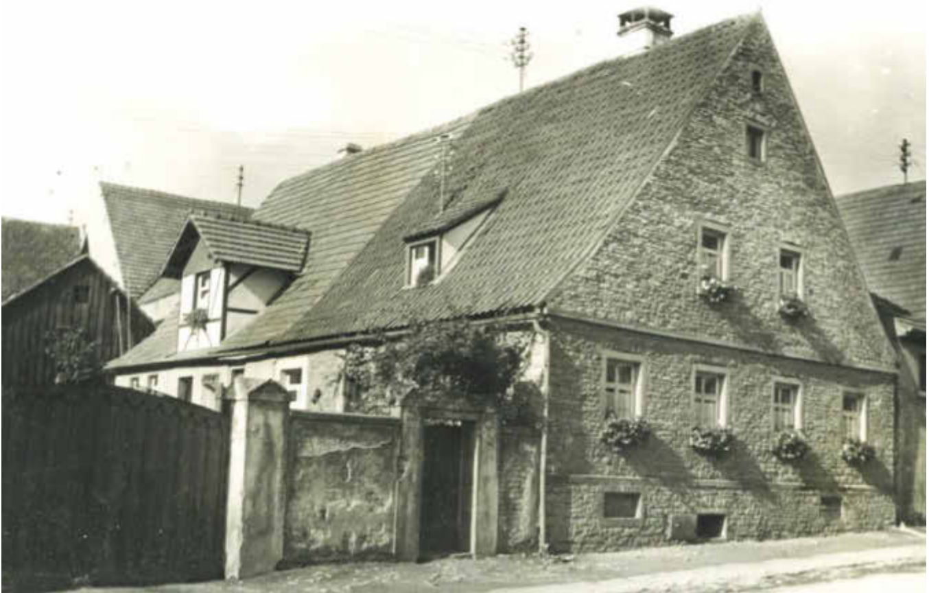
Anwesen Rauch Kretz

Wo schlummern noch alte Fotografien von alten Anwesen?