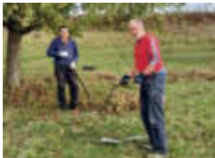
Pflege der BN-Wiese

Streuobstwiesen sind Lebensraum für viele!