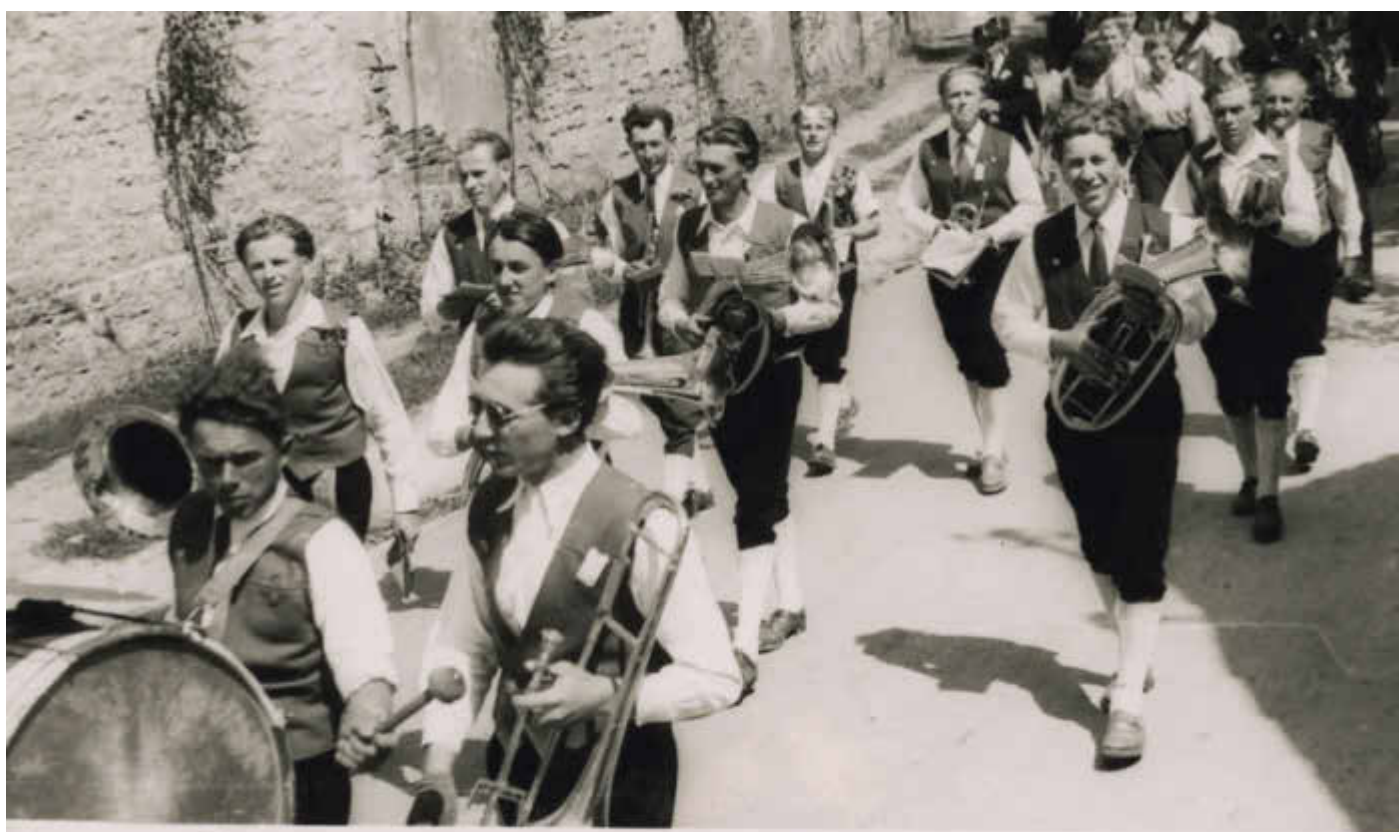
80 jähr. Gründungsfest und Fahnenweihe der Freiw. Feuerwehr Prosselsheim am 3. u. 4. Juli 1954